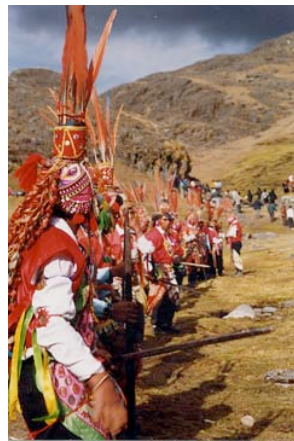
Andien alueen Q'ero-kansalle kokapensas on pyhä kasvi.

Maailmanlaajuisia ongelmia näiden perinnekasvien viljelystä on seurannut vasta sen jälkeen, kun länsimainen lääketiede on jalostanut niistä voimakkaita ja helposti kuljetettavia huumausaineita. Yhden kokaiinikilon valmistamiseen tarvitaan jopa 500 kiloa kokapensaaseen lehtiä. Kokapensaaseen lehti on Andien ilmastossa elämää helpottava ja vitamiinipitoinen piriste. Kokaiini on terveydelle varallinen ja voimakasta riippuvuutta aiheuttava huume.